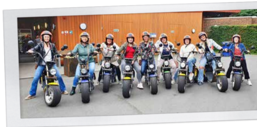
Het team van woning 1 tijdens een teamuitje: natuurlijk moest er even geposeerd worden bij Boswijk.

Britt vervolgt: "Door het werken met mensen met een andere professionele achtergrond, leer ik ook weer veel. Het medische wat meer loslaten