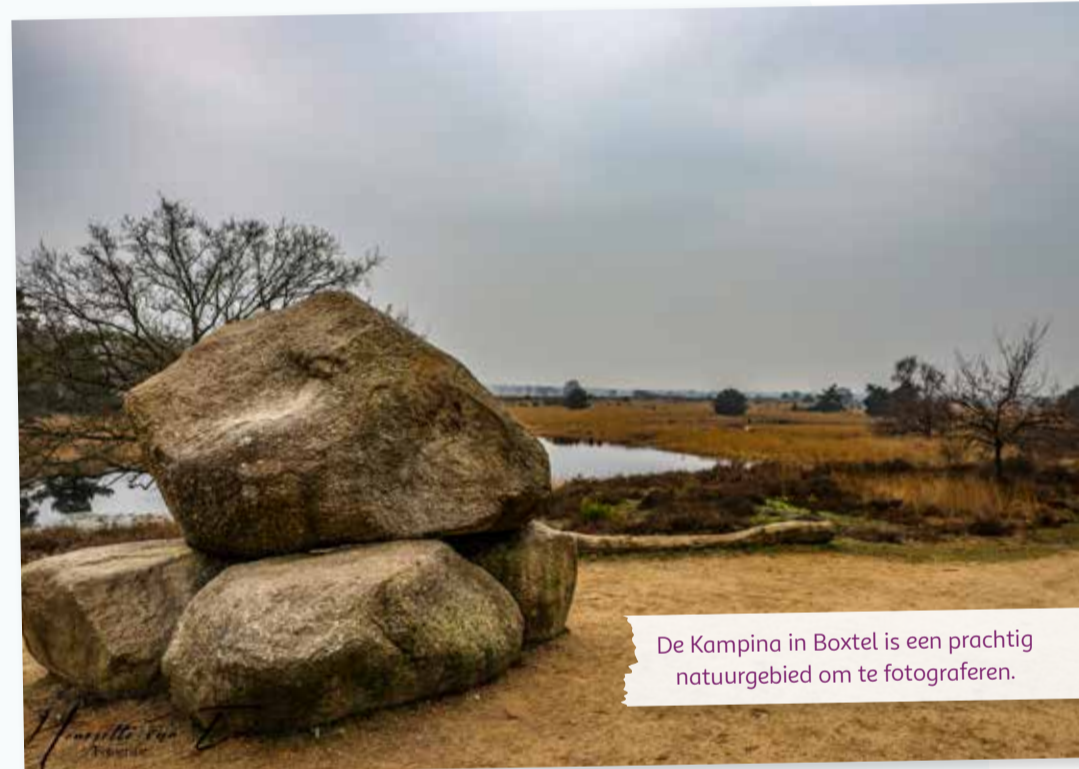
De Kampina in Boxtel is een prachtig natuurgebied om te fotograferen.

Het hele eiland heb ik gezien, en talloze foto's gemaakt. Van de zee, zeehonden, de vuurtoren, maar ook mooie composities zoals een hek met daarachter het water.”