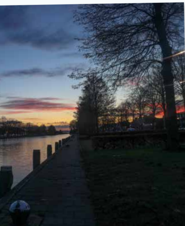
Zonsopgang bij de Zuid Willemsvaart. In de zomer zoek ik vaak plekjes op waar ik een mooie zonsopkomst of -ondergang kan fotograferen.