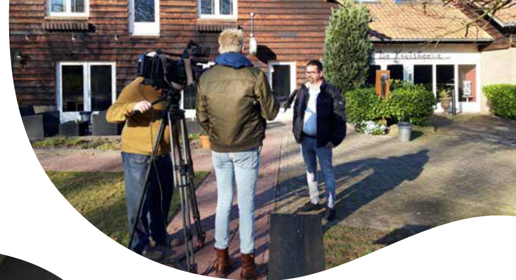
Volop aandacht van de media tijdens de opening van CZC Vught.