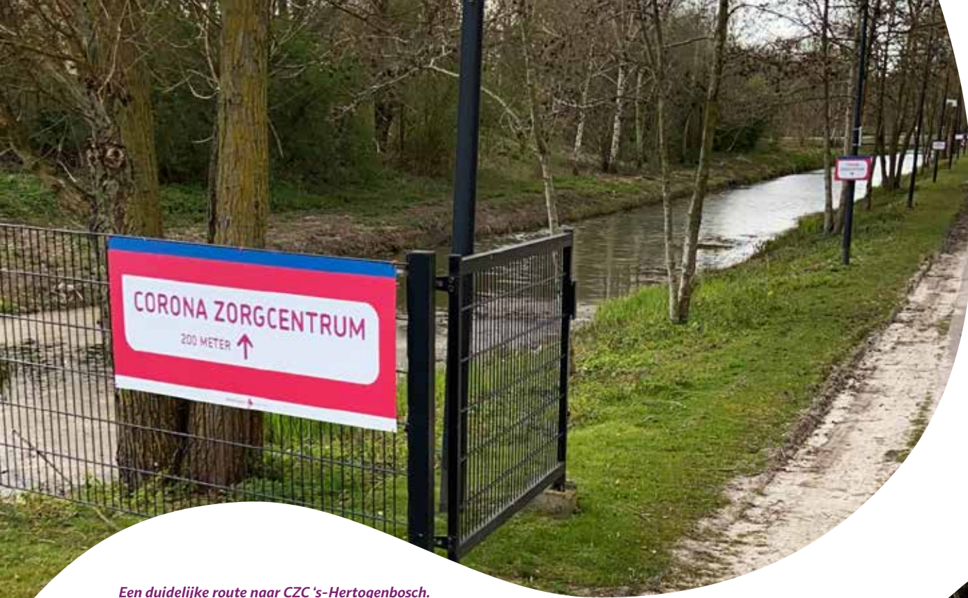
Een duidelijke route naar CZC 's-Hertogenbosch.