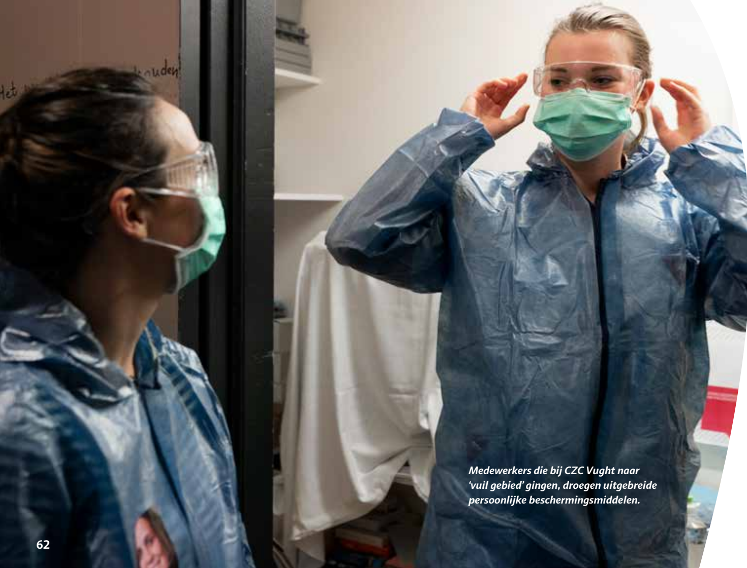
Medewerkers die bij CZC Vught naar 'vuil gebied' gingen, droegen uitgebreide persoonlijke beschermingsmiddelen.