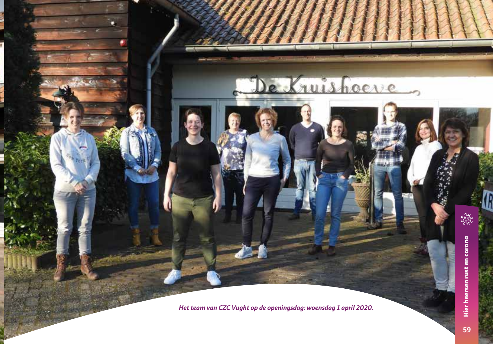
Het team van CZC Vught op de openingsdag: woensdag 1 april 2020.

Snapshots, professionele afbeeldingen van een fotograaf van de krant, en foto's van medewerkers: de coronazorgcentra zijn op verschillende momenten vastgelegd. Een bloemlezing in beeld.