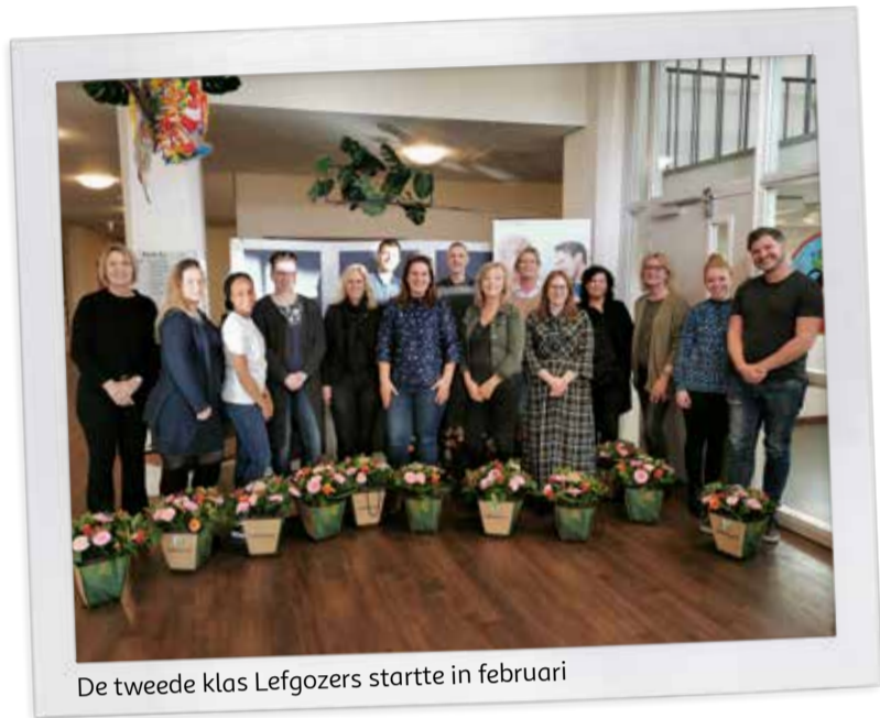
De tweede klas Lefgozers startte in februari

In de zorg zijn zo'n 140.000 extra medewerkers nodig, waaronder 31.200 mbo-verzorgenden. De grootste groep potentiële kandidaten zijn de zij-instromers. Mensen die al een baan hebben, maar best naar de zorg willen overstappen. Door het bijzondere project Lefgozer m/v zijn Lefgozers snel volledig inzetbaar en gekwalificeerd personeel dat zich duurzaam verbindt aan een organisatie.