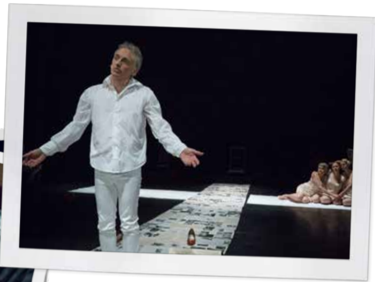
De slotscène van 'Madonna's Man'.