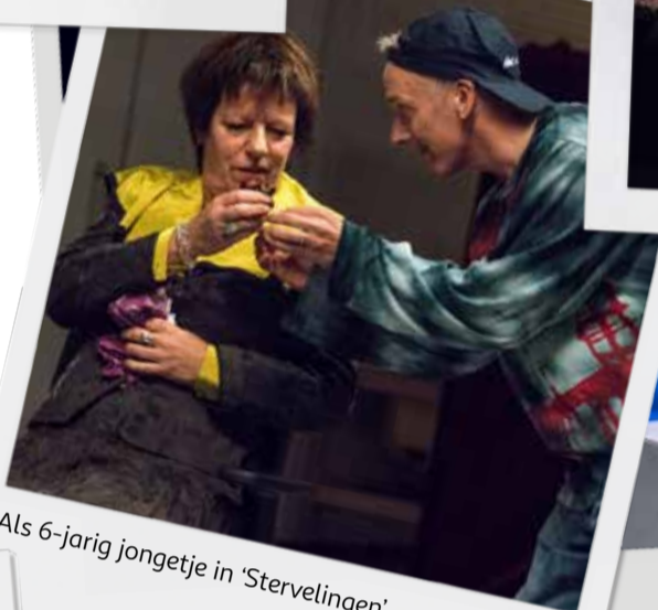
Als 6-jarig jongetje in 'Stervelingen'