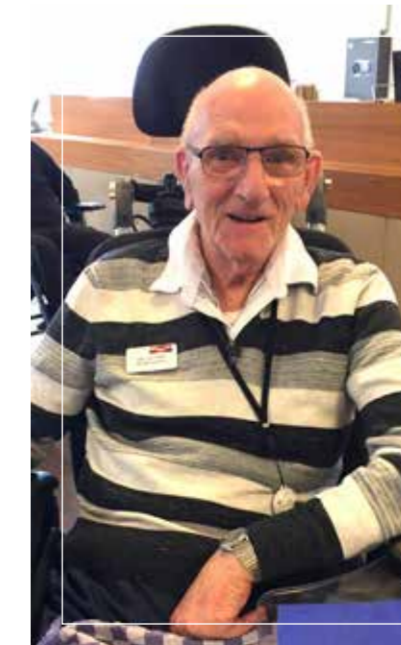
Met trots draagt de heer Van Oijen zijn badge iedere dag.